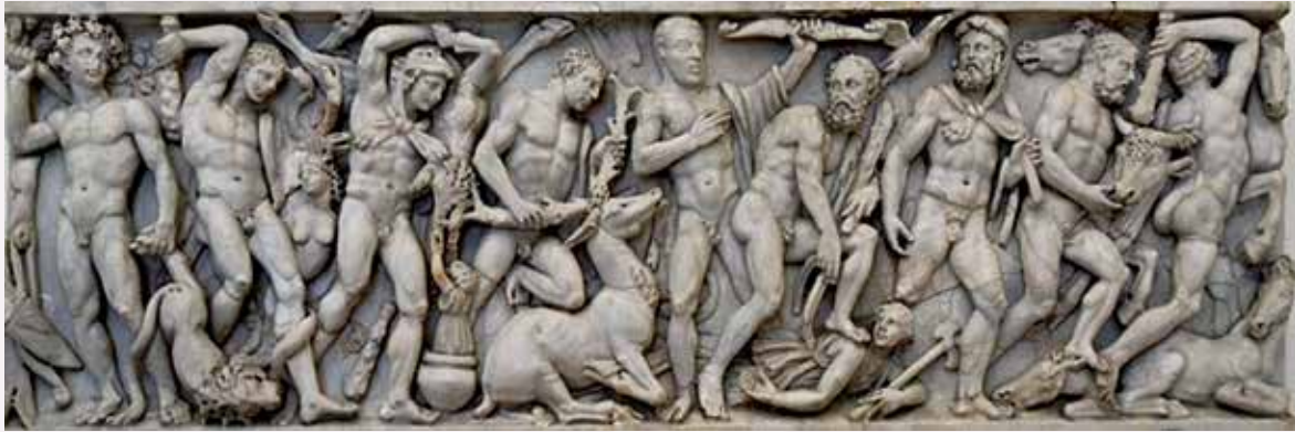
Άθλοι του Ηρακλέους, αναπαράσταση από σαρκοφάγο 300 μ.Χ., Εθνικό Μουσείο Ρώμης.